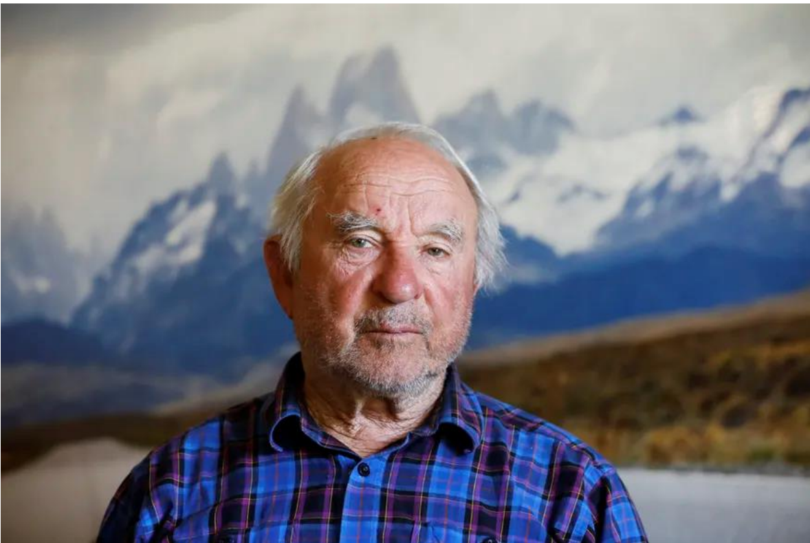
Yvon Chouinard, Creador y ex-dueño de Patagonia.

Pero la reparación de la historia familiar no es la única razón por la cual las personas ricas están comenzando a redefinirse. Hay algunos de ellos que, desde que iniciaron sus empresas, han visto la sustentabilidad como un eje en la creación de sus productos. Ese es el caso de Yvon Chouinard, creador de la marca «Patagonia», quien luego de generar una empresa multimillonaria, consideró que el